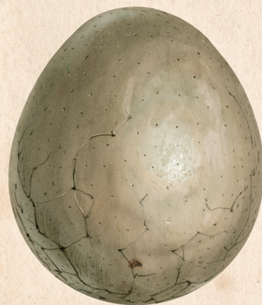
OPALESCENT DE LA ANTIPOZI