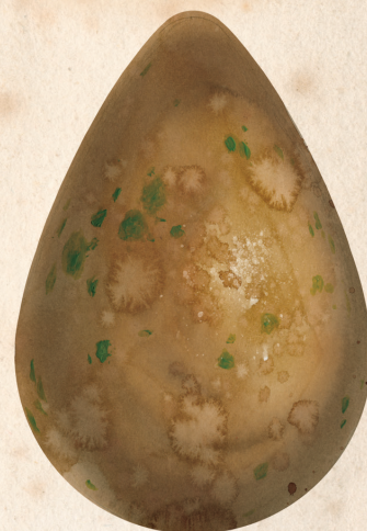
VERDE PITIC DE ȚARA GALILOR