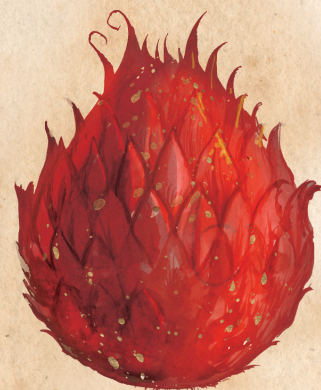
MINGE DE FOC DE CHINA