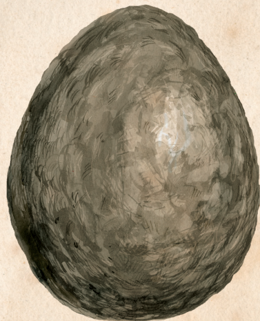
COARNE-N COADĂ UNGURESC

DIN „CREȘTEREA DRAGONILOR PENTRU PLĂCERE ȘI CÂȘTIG“