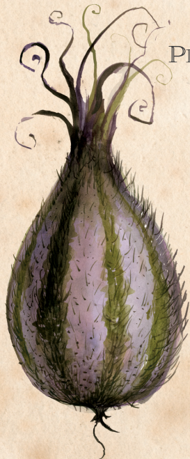
NEGRU DIN HEBRIDE